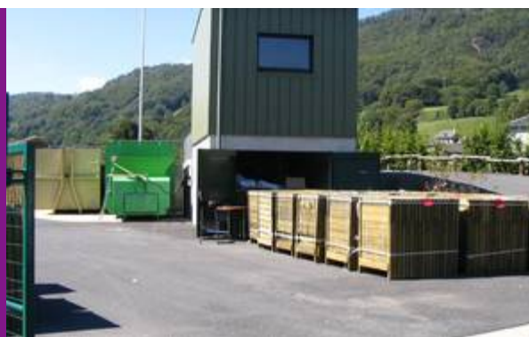
Les composteurs stockés

* Nous vous rappelons que lors de l'achat d'appareils électriques neufs (électroménagers, informatique, téléviseurs, ...) le revendeur a l'obligation de vous reprendre votre ancien appareil. En effet, le coût du nouvel équipement comprend une éco-taxé pour financer le traitement de ces vieux équipements...alors pourquoi payer deux fois ?