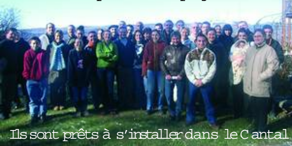
Ils sont prêts à s'installer dans le Cantal