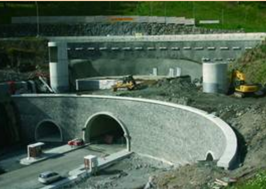
Tête du nouveau tunnel, côté Murat