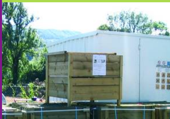
Un composteur en bois de 575 L