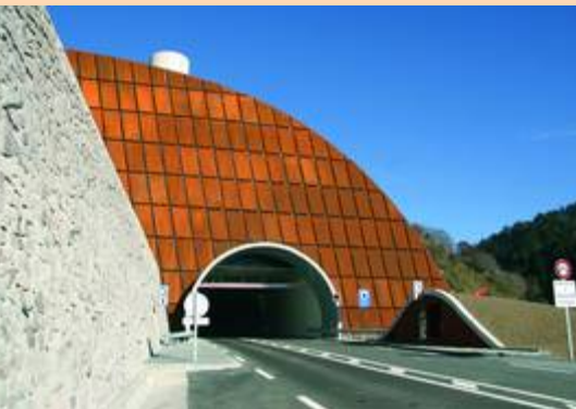
Tête du nouveau tunnel, côté Arillac