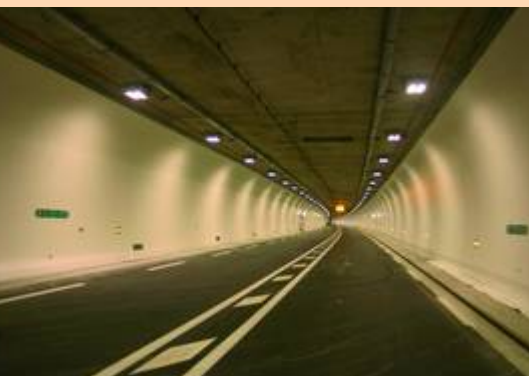
Intérieur du nouveau tunnel