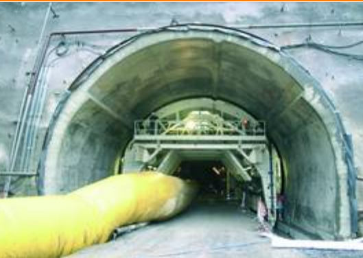
Coffrage du nouveau tunnel