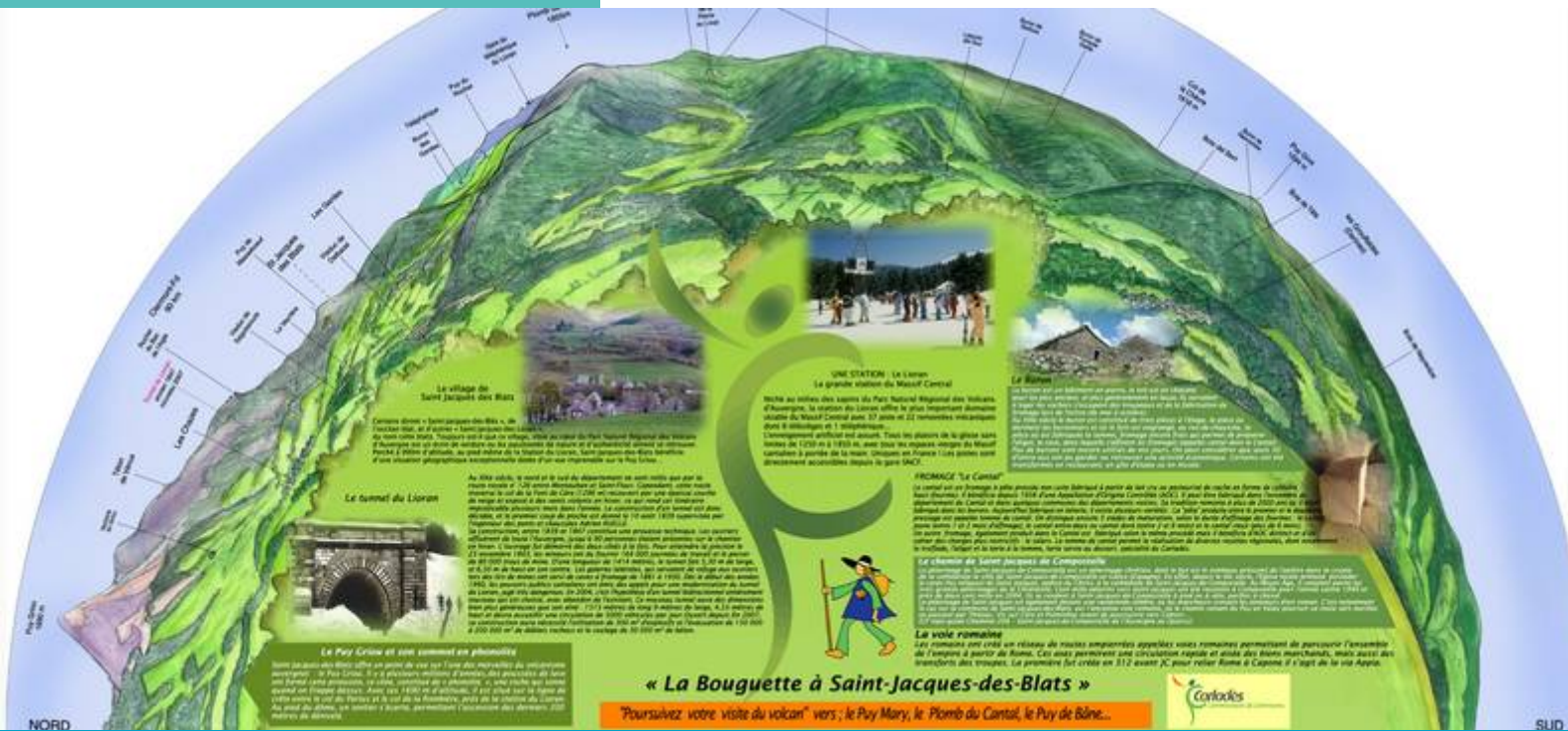
La table de lecture du paysage de la Bouquette présente le paysage et offre des éclairages sur les burons, le tunnel du Lioran ou la voie romaine...